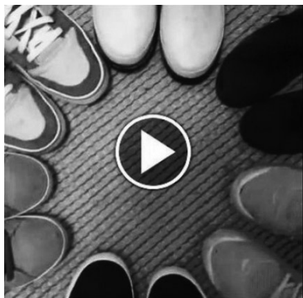
Hashtag # dulbeg: Bildet av flere skotupper i ring indikerer at mange sitter tett sammen og er hypersosiale. Videoen fikk 6700 likes på et blunk, før den ble slettet. Hashtag # dulbeg står for «du lever bare én gang».

og passord. Uten nett spilte de: «Subwaysurf» og «Bikerace» (de sosiale mediebrukerne), «Guess the Brand» og «Guess the Place» (nettsurferen). Med nett var de gjerne inno­m tv2.no og vg.no. men etter at de hadde sjekket sine favoritter: Man U, den andre Liverpool og Tour de France, helst rett på Facebook for jenta. Vi nektet dem telefonbruk under selve maten, til en del munnhuggeri med potensial for IRL. Deres tyngste argument var at det var så kjedelig å vente på maten. Ingen av dem angret imidlertid på at de ikke hadde tatt med datamaskin, det ville gått ut over brunfargen, mente de, selv om det hendte de på stranden klagde på solen, og heller oppsøkte en trådløs strandkafé. Mye tyder på at de faktisk ikke trenger datamaskinen annet enn til skolearbeid, som jo ofte også kommer i kategorien kjedelig. Vel, tv-serier finnes, og konsumeres gjerne individuelt på dataskjerm på rommet hjemme.