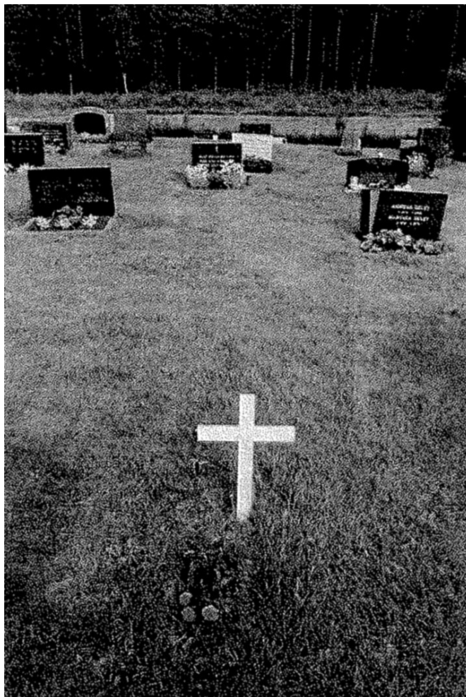
GRAVFERD: Eg greip meg i å ønske eg sjølv fekk ei slik avslutning, skriv Edvard Hoem.