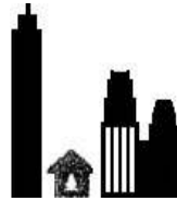
HVA ER PRIVATLIV? Privatlivet har aldri vært mer eksponert. Er det så farlig?

Nettsurferen fortalte for eksempel at han hadde